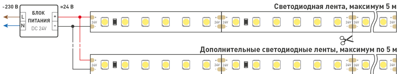
Схема 1. Подключение нескольких светодиодных лент с одной стороны.

Максимальная длина подключения ленты – 5 м (1 катушка).