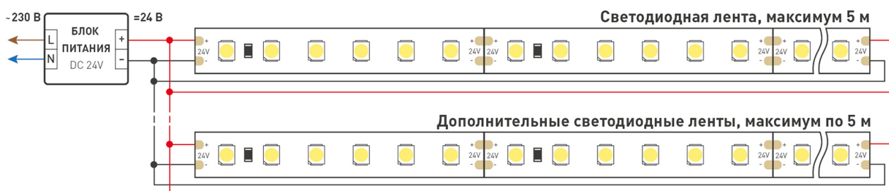
Схема 2. Подключение нескольких светодиодных лент с двух сторон.

Рекомендуется использовать для обеспечения равномерного свечения ленты по всей длине.