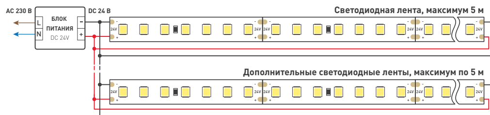
Рис. 2. Подключение нескольких светодиодных лент с двух сторон