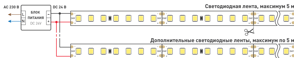
Рис. 1. Подключение нескольких светодиодных лент с одной стороны